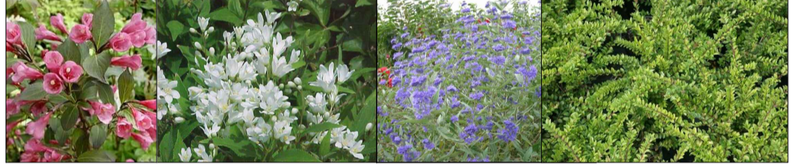
weigela bruidsbloem baardbloem struikkamperfoelie