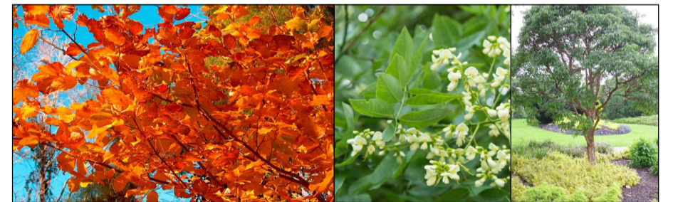
perzisch ijzerhout (1) honingboom (2) papieresdoorn (3)