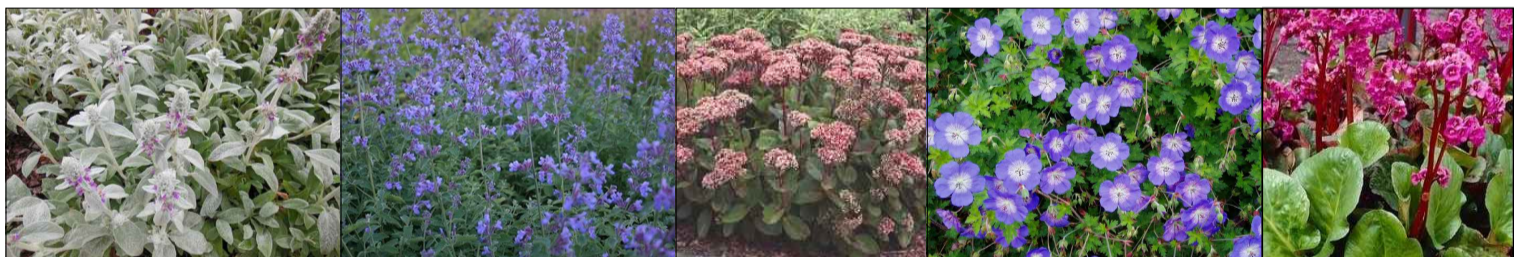
ezelsoor kattenkruid hemelsleutel ooievaarsbek schoenlappersplant