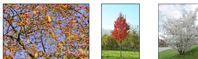
sierappel, zuilvormig(1) rode esdoorn (2) sierkers (3)