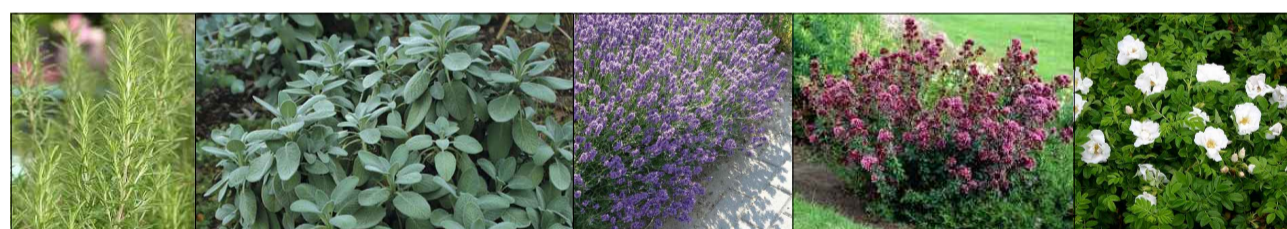
rozemarijn salie lavendel oregano rozen