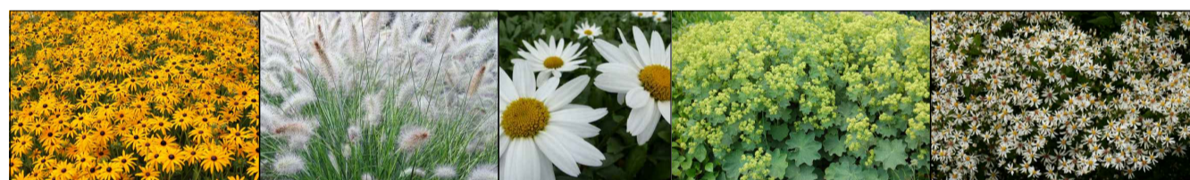
zonnehoed lampenpoetsergas margriet vrouwenmantel sneeuwaster