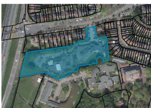
Oegstgeest, sectie B, nummer 3684

inleiding Aan de percelen kadastraal bekend gemeente Oegstgeest, sectie B, nummers 3678 en 3684 is in de Omgevingsvisie Oegstgeest, zoals vastgesteld op 23 maart 2023 door de gemeenteraad van Oegstgeest, de functie van 'Mogelijke ontwikkellocatie wonen en voorzieningen (indicatief)' toegedacht. De gemeente wil de regie houden op deze locatie met als doelstelling om te komen tot een uitvoerbare herontwikkeling in overeenstemming met de in de omgevingsvisie toegedachte functie. Om te voorkomen dat de eigendomsrechten en/of beperkte rechten worden gesplitst of worden vervreemd aan partijen met speculatieve doeleinden, waardoor de gemeente mogelijk grip op de (beoogde) herontwikkeling van het gebied verliest, is het in het algemene belang dat een gemeentelijk voorkeursrecht wordt gevestigd. Bij besluit van 2 juli 2024 hebben wij besloten om met toepassing van art. 9 lid 2 Omgevingswet besloten een voorlopig voorkeursrecht te vestigen. Door middel van het onderhavige raadsvoorstel wordt aan u voorgesteld om het voorkeursrecht te bestendigen. De beide percelen zijn hieronder weergegeven.