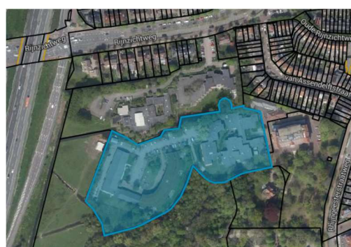
Oegstgeest, sectie B, nummer 3678

Momenteel bevinden in het gebied op het perceel met nummer 3678 het gebouw, plaatselijk bekend Rijngeeststraatweg 13 A en 13C, waar via het Centraal Orgaan opvang Asielzoekers (COA) tijdelijk statushouders en waar via Divorce Housing Spoedzoekers worden gehuisvest. Voor deze woonvormen is een tijdelijke vergunning verleend. Op het perceel met nummer 3684, plaatselijk bekend als Rijnzichtweg 35, is ARQ Centrum '45 gehuisvest, een landelijk expertisecentrum voor de behandeling van mensen met ernstige psychotraumatische klachten. Deze functie is passend binnen het bestemmingsplan. Voor de beide percelen geldt dat de in de omgevingsvisie aan de locatie toegedachte functie afwijkt van het huidige gebruik.