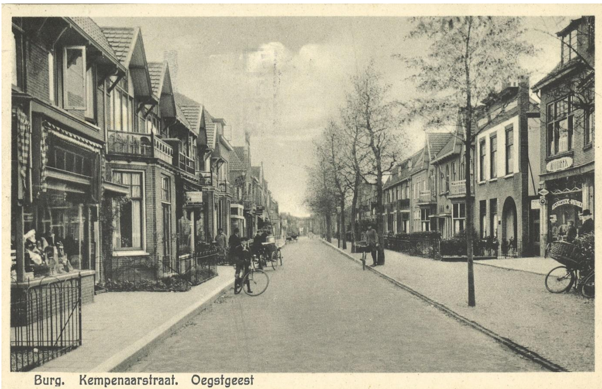
Burg. Kempenaarsstraat. Oegstgeest

Ook de 5 mei kindervrijmarkt, de PaasHaaswijkloop en de specifieke Oegstgeester invulling van Konings-/Koninginnedag worden beschouwd als een karakteristiek evenement van Oegstgeest en staat als immaterieel erfgoed op de in bijlage 3 opgenomen erfgoedlijst van Oegstgeest. De gemeente zal zich blijvend inspanssen om dit evenement te behouden door de organisatie van dit evenement te faciliteren.